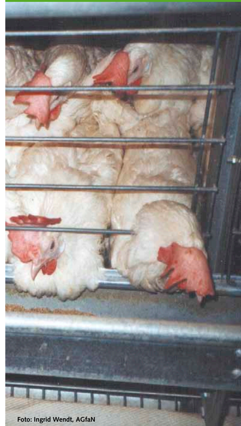
V.i.S.d.P.: BÜNDNIS 90/DIE GRÜNEN im Landtag Niedersachsen, Hinrich-Wilhelm-Kopf-Platz 1, 30159 Hannover